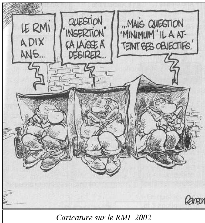
Caricature sur le RMI, 2002