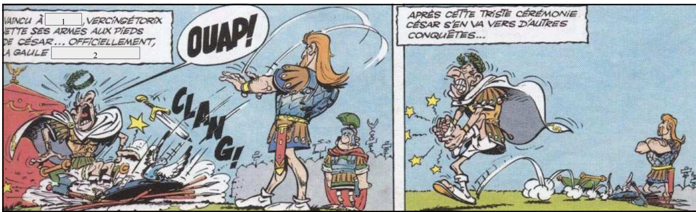
Extrait de Astérix et le bouclier arverne , par Goscinny et Uderzo

D'après César, La Guerre des Gaules : « Vercingétorix convoque l'assemblée des Gaulois : il déclare que cette guerre a été entreprise pour la liberté de tous les Gaulois ; il s'offre donc à eux : ils peuvent le livrer vivant aux Romains. On prévient César de ce sujet : il ordonne qu'on lui remette les armes, et qu'on lui amène les chefs des cités gauloises. » Tg