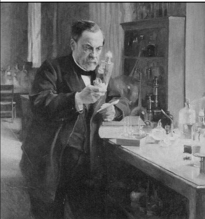
Pasteur dans son laboratoire

1 - Qui est la personne sur le document ?