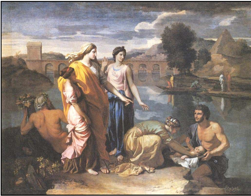
Nicolas Poussin, Moïse sauvé des eaux , 1638 ↗