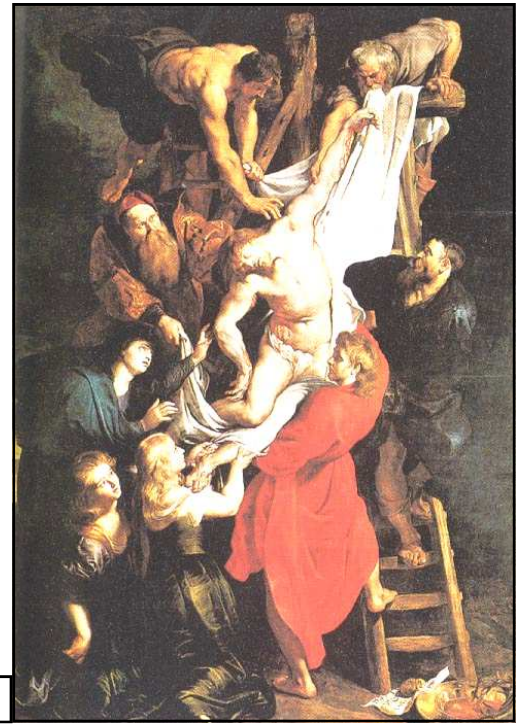
Pierre Paul Rubens, La descente de croix , 1612 →

1 - Présente ces documents, et trouve leur un point commun : _____