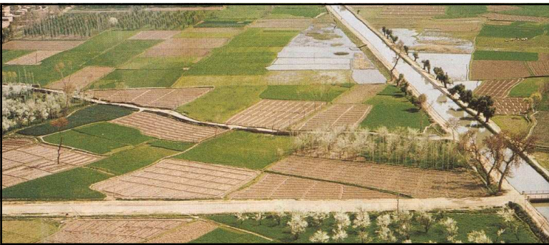
Inde, au Pendjab, parcelles irriguées